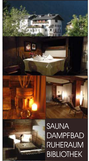
SAUNA DAMPFBAD RUHERAUM BIBLIOTHEK